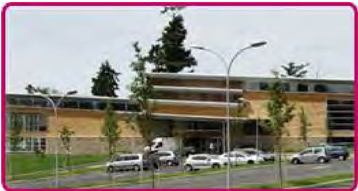
CLUB AREDIEN DE LUTTE (Saint Yrieix la Perche)